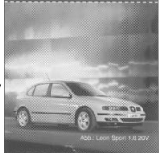
Abb.: Leon Sport 1.8 20V

Der Leon 1.9 TDI ist Testsieger im Auto * 8/2000. Fazit der Tester: "Seine Sportlichkeit ist seine Stärke".